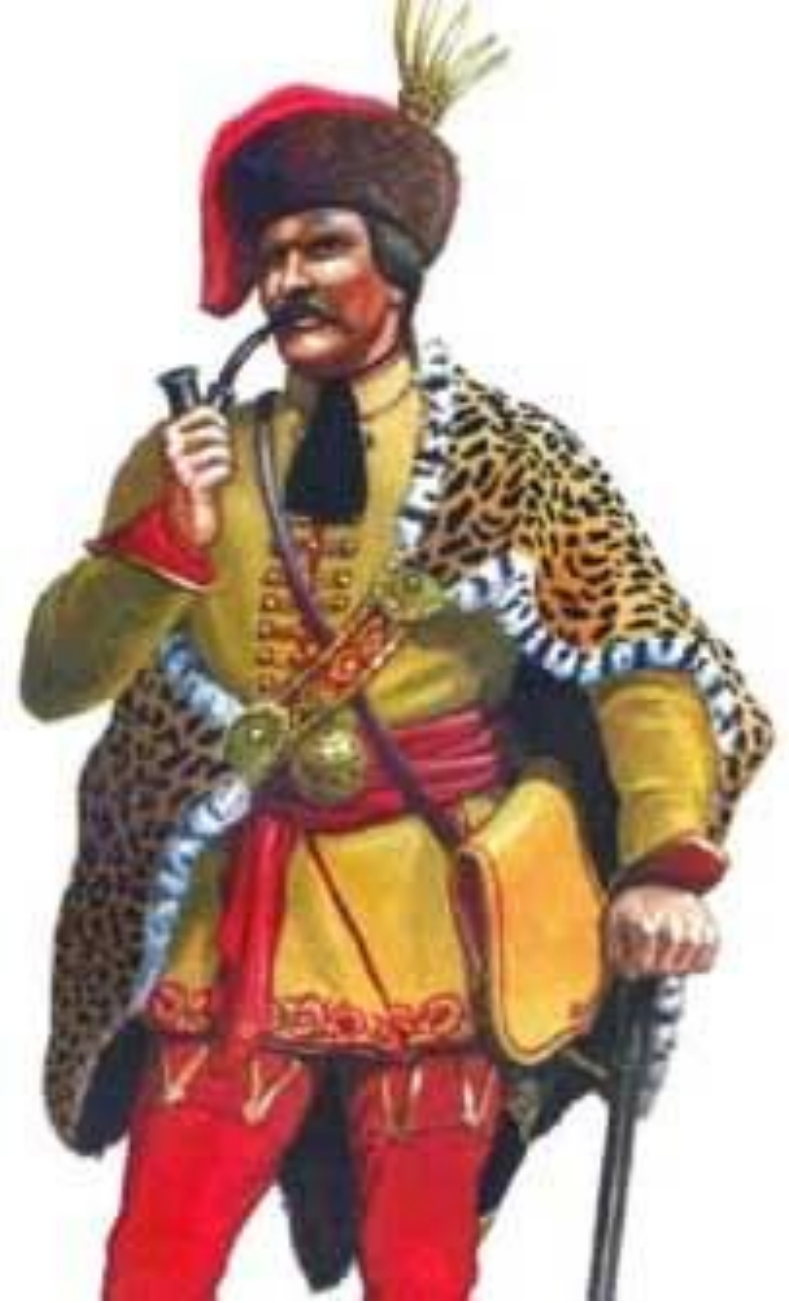
Magyar huszárkapitány (vízfestmény)