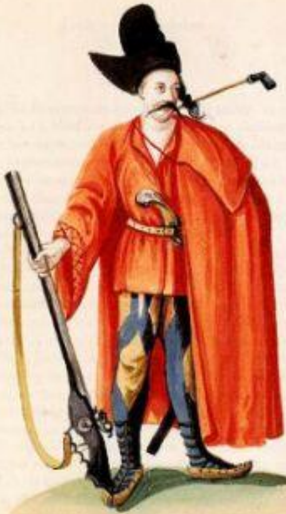
A Talpas or Foot Soldier